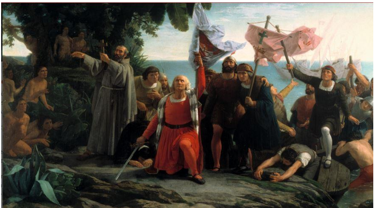
Débarquement de Colomb en Amérique par Dioscoro Puebla (1862, musée du Prado, Madrid) ; œuvre d'imagination et de propagande (il n'y avait normalement pas de prêtre dans l'expédition)

Consigne : Après avoir identifié le document, présentez les objectifs des voyages européens de découvertes. Montrez que cette scène témoigne de la situation d'infériorité des Indiens.